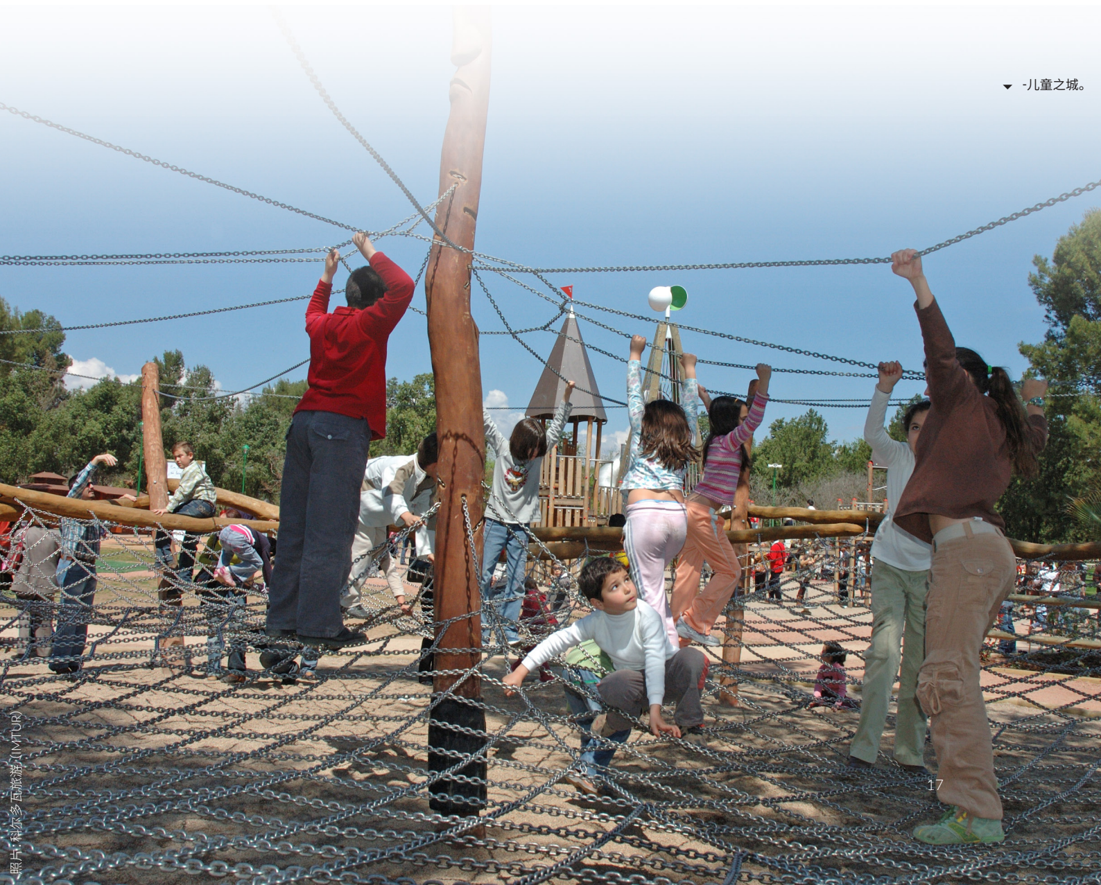
▼ - 儿童之城。

在这里,你可以通过Linneo大街进入科尔多瓦动物园。如果你想在这个美丽的城市度过几日时光,这个充满异国情调的舒适场所非常值得参观游玩。