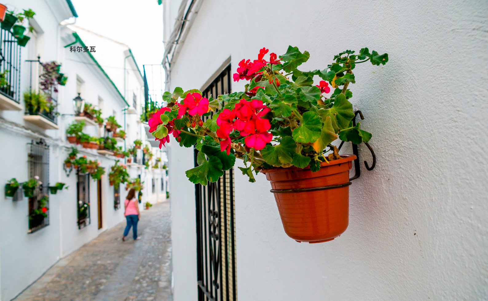
▲ 科尔多瓦的普列戈

如果你想了解该地区最古老的城镇之一，可以前往迷人的卡布拉(Cabra)。这里被山脉、泉水和美丽的自然景观环绕，两侧的围墙和美丽的卡布拉公爵城堡保留了安达卢西亚的历史痕迹。此外，这里还有安达卢西亚最有趣的巴洛克风格建筑群之一，包括圣母升天和天使教堂等瑰宝。