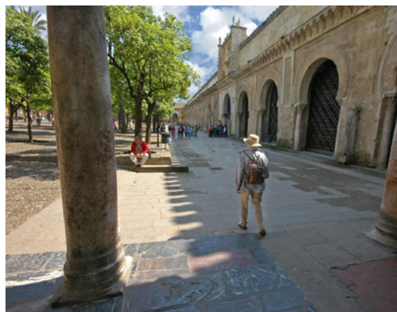
▲ 橘树庭院 科尔多瓦大清真寺

不出几米你就能找到科尔多瓦的灵魂和心脏——清真寺-大教堂，这里被列为人类遗产。可以通过救赎之门进入教堂。美丽的橘树庭院是清真寺内部带有无数双色马蹄形拱门的大殿的前厅。