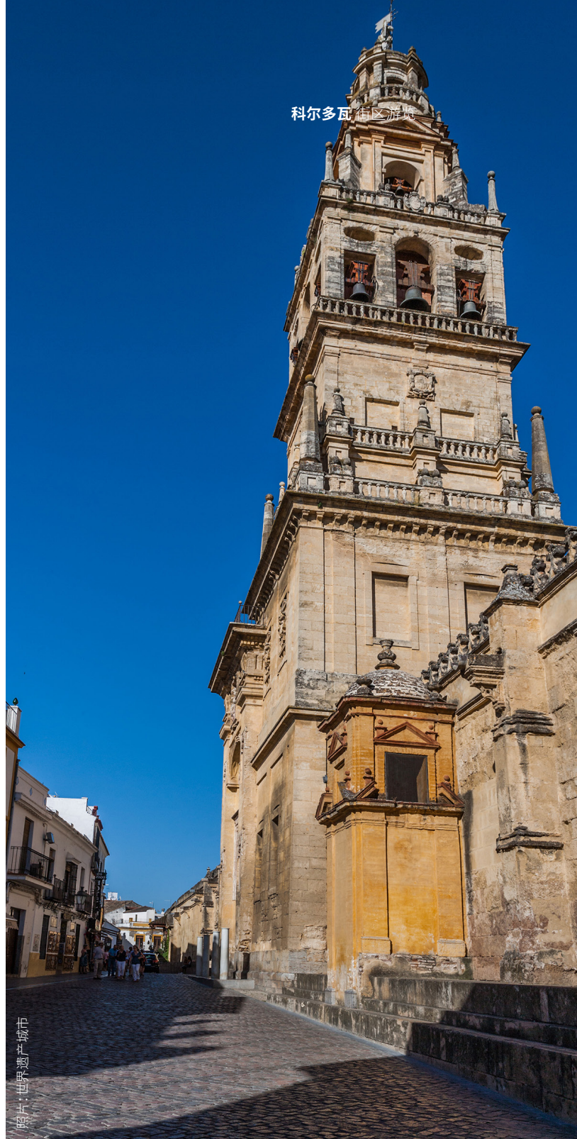
市城文化遗产 照片

附近是市政露天市场。这个美丽的市场位于一座穆德哈尔风格的两层建筑中,科尔多瓦的手工艺人会在这里兜售他们精心制作的传统银器、瓷器和皮具。你可以在这里购买精美的纪念品。