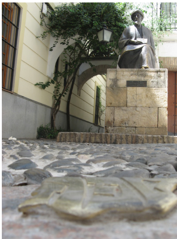
▲ 迈蒙尼德的雕像和广场

在同一个犹太区，你也可以参观塞法拉德之家 - 记忆之家，从文字记录中了解科尔多瓦过去的希伯来文明。这里有8个永久展示厅，你可以在此探索犹太传统以及随后在散居地的发展。