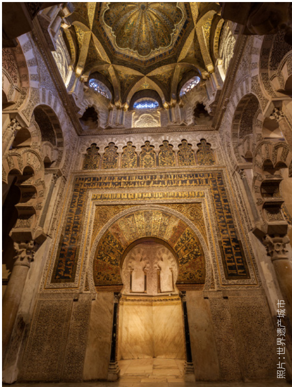
市城文化遗产 照片