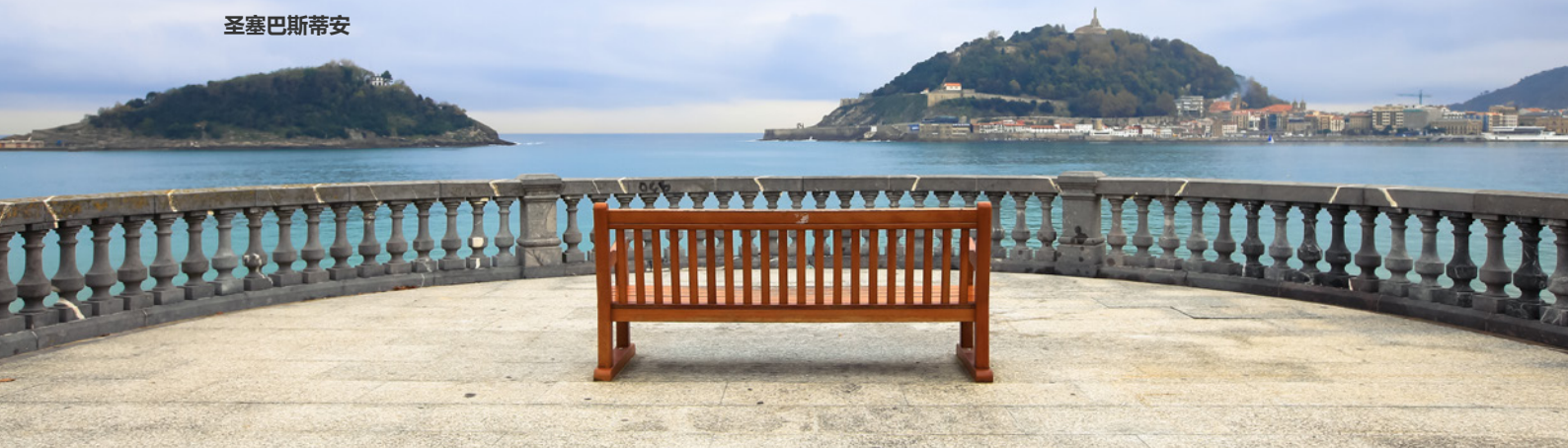
▲ 海滨路 贝壳海滩