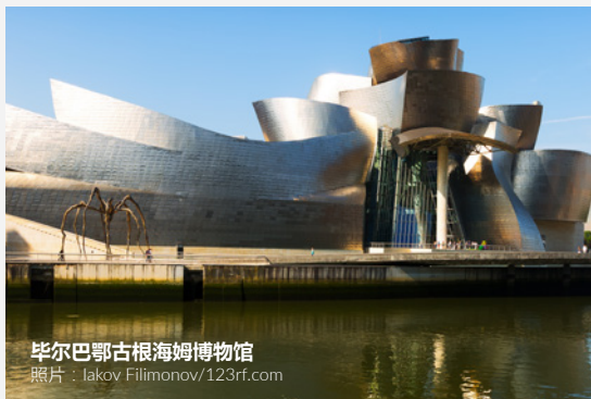
毕尔巴鄂古根海姆博物馆

参观加拿大建筑师弗兰克·盖里设计的古根海姆博物馆。被认为是二十世纪下半叶的最佳建筑，是比斯开省首府重建项目的旗舰之作。你可以到老城区品尝点开胃小吃 pintxos 。