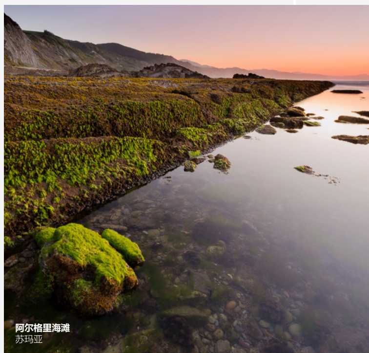
阿尔格里海滩 苏玛亚

游览蜿蜒60公里的吉普斯夸海岸，让面向坎塔布里亚海的悬崖带给你震撼的感觉吧。在小渔村停留一下，下海游个泳，再在海边品尝美食。或者探访巴斯克海岸地质公园，其横跨坎塔布里亚海、巴斯克群山以及穆德里库（Mutriku）、德巴（Deba）和祖马伊亚（Zumaia）地区。