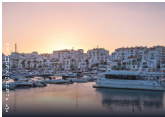
▲ 巴努斯港 玛维亚

深达 150 米的峡谷将城市一分为二，一定会让你大为震惊。你还会看到穿过峡谷的三座桥：最有名的是建于十三世纪的新桥。到老城区转转，这里独具中世纪风格，又融入了阿拉伯文化的影响。