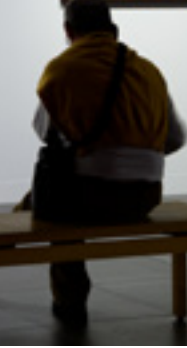
俄罗斯圣彼得堡博物馆的展品