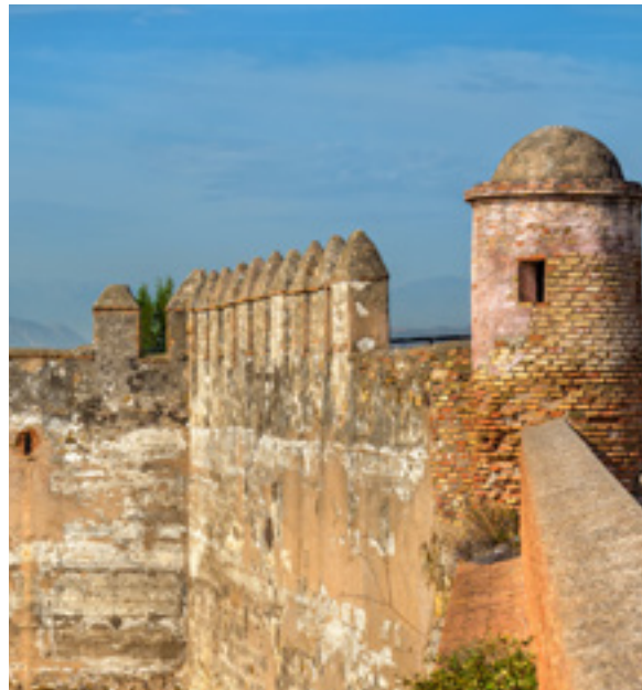
▲ 希布拉尔法罗城堡

想要沉醉于这座城市从古罗马时期到当今的历史，那就跟随马拉加历史古迹线路游览。在线路的末尾，别忘了参观一下希布拉尔法罗 ( Gibralfaro ) 城堡。