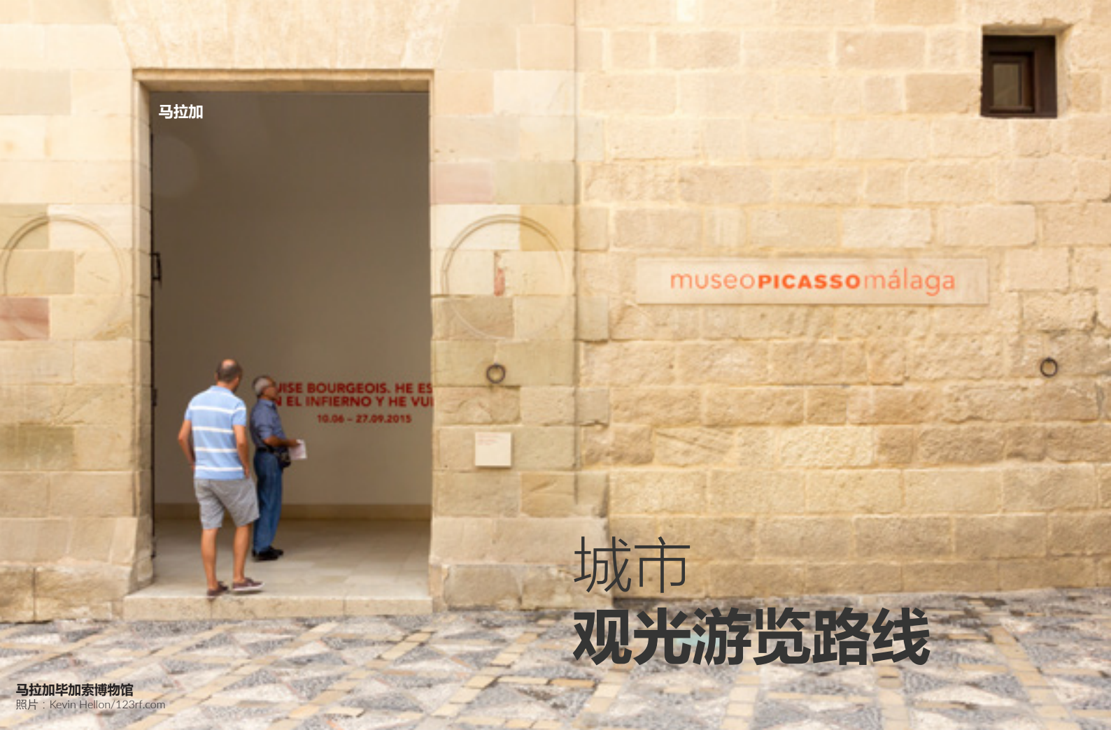
马拉加毕加索博物馆