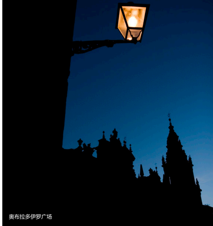
奥布拉多伊罗广场

请参观贝尔维斯修道院和威严的梅诺尔神学院，它们被一条天然护城河与名胜古迹区分割开。接下来，在贝尔维斯公园漫步。在高处，你将欣赏到城市的美景。