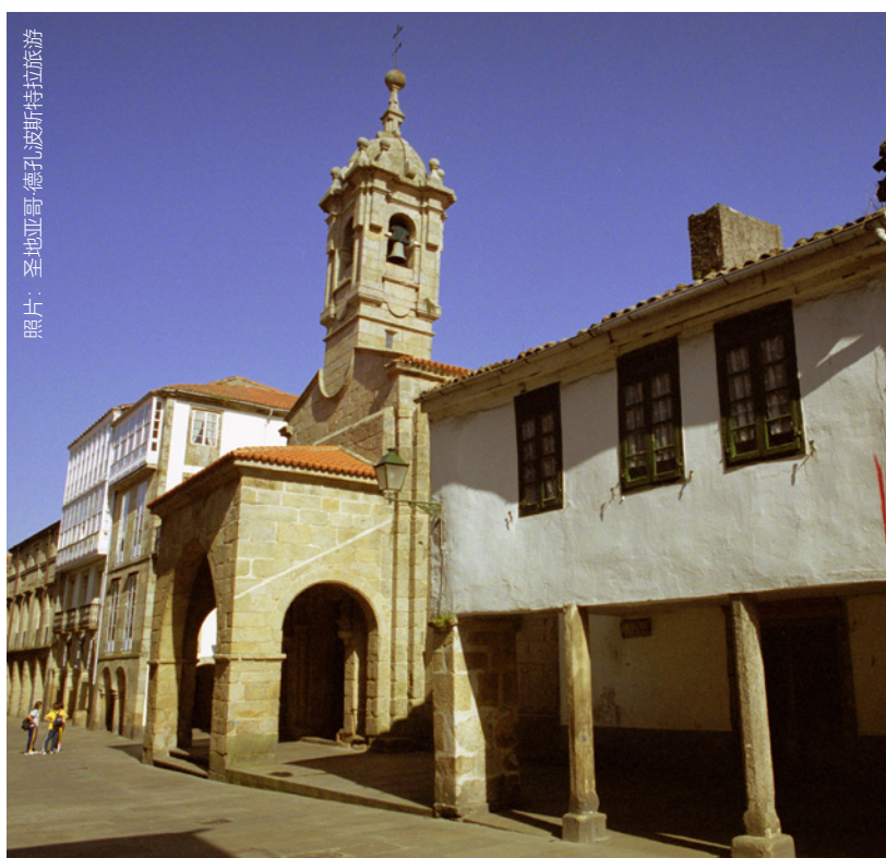
照片：圣地亚哥·德孔波斯特拉旅游

或者参观一个十分原创而不同的博物馆： 特洛伊府邸 。你是否想象过十九世纪的学生生活是什么样子的？这里重现了由“慷慨女士”