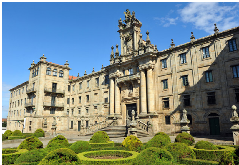
▲ 圣马丁皮纳利奥修道院

金塔纳广场 是圣地亚哥老城区最具代表性的空间之一。这里有 钟塔 ，从城中几乎每一个角落都可以看到它。迷失在它周围的街道上，在这里你总能找到一座巴洛克风格的房