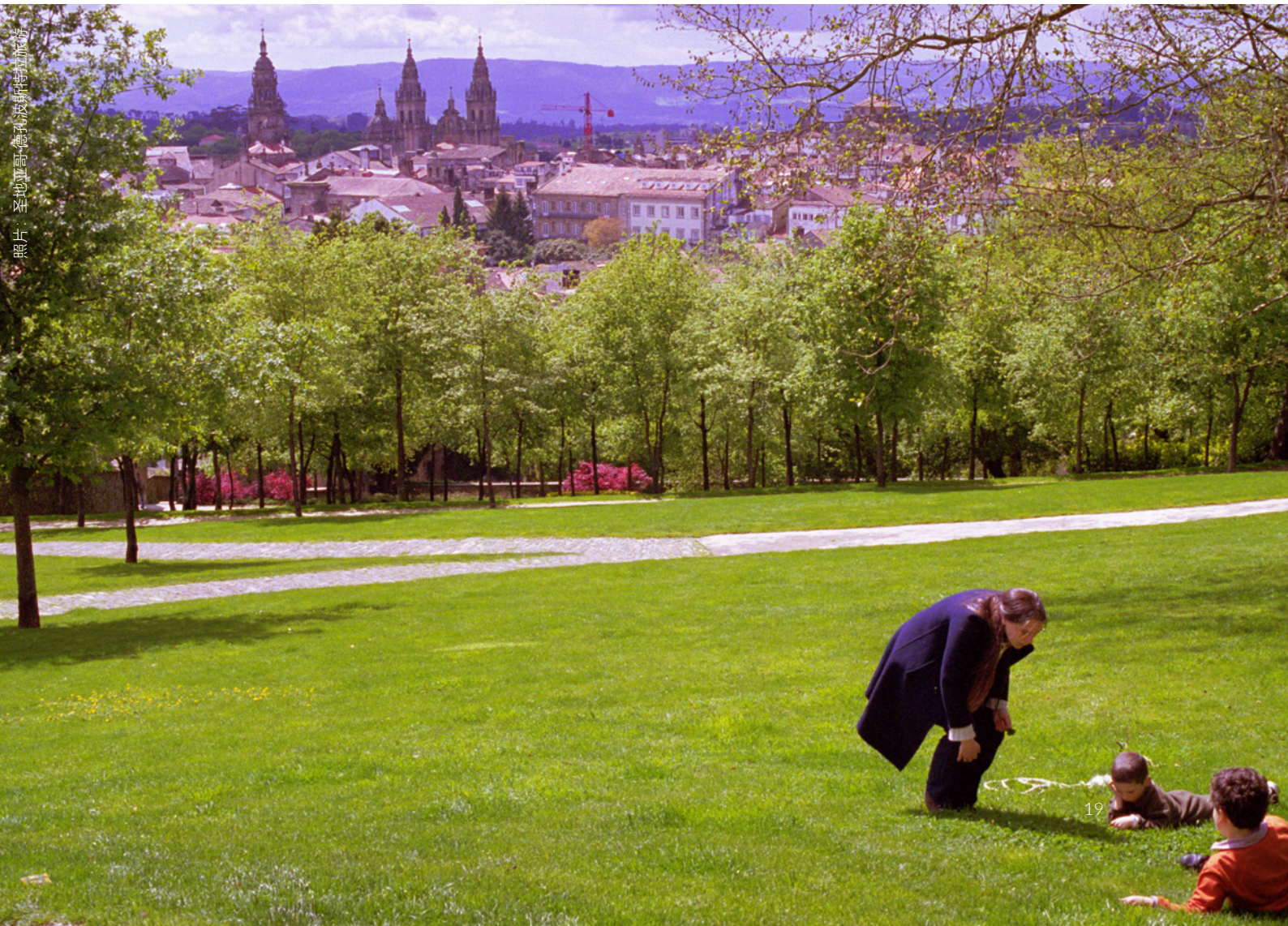
照片：圣地亚哥-德孔波斯特拉