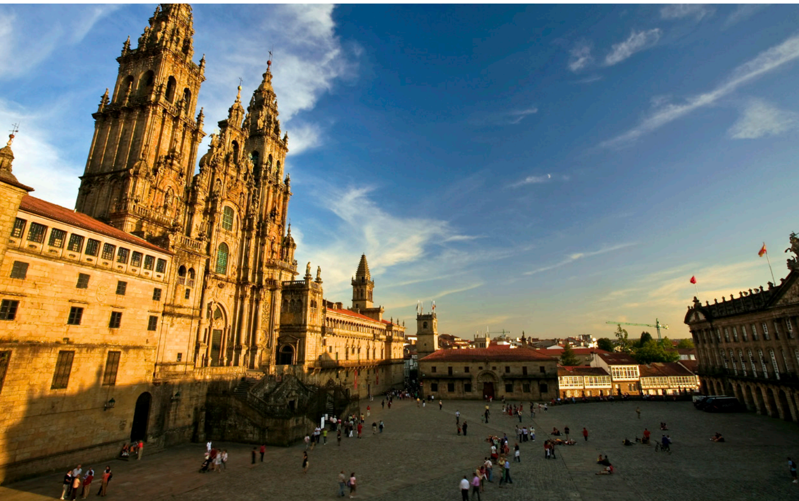
▲ 奥布拉多伊罗广场