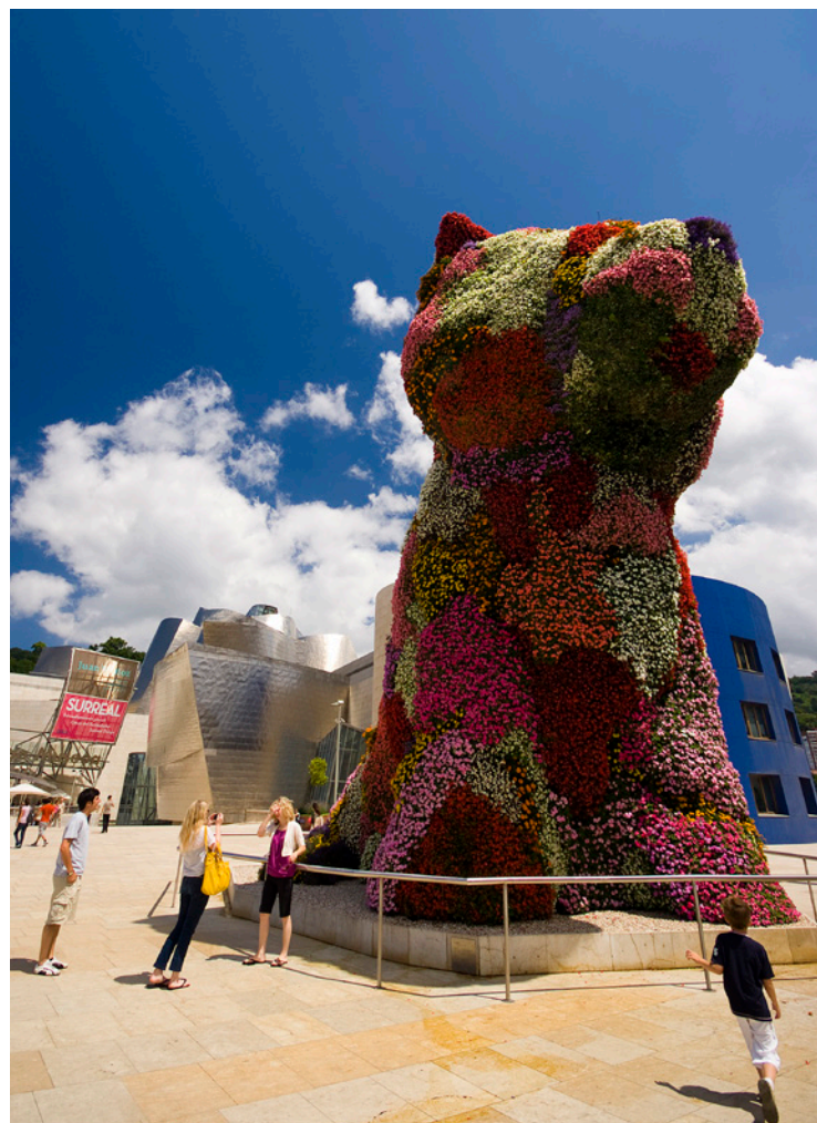
▼ 毕尔巴鄂古根海姆博物馆

10月11日是 贝戈尼亚圣母节 ，会举办一个热闹的包括音乐会、游行、儿童活动、舞蹈和巴斯克乡村运动。在 乌纳姆诺广场 耸立着一些历史悠久的阶梯，即所谓的“ 马约纳之路 ”，它连接了老城区和美丽的哥特式教堂。