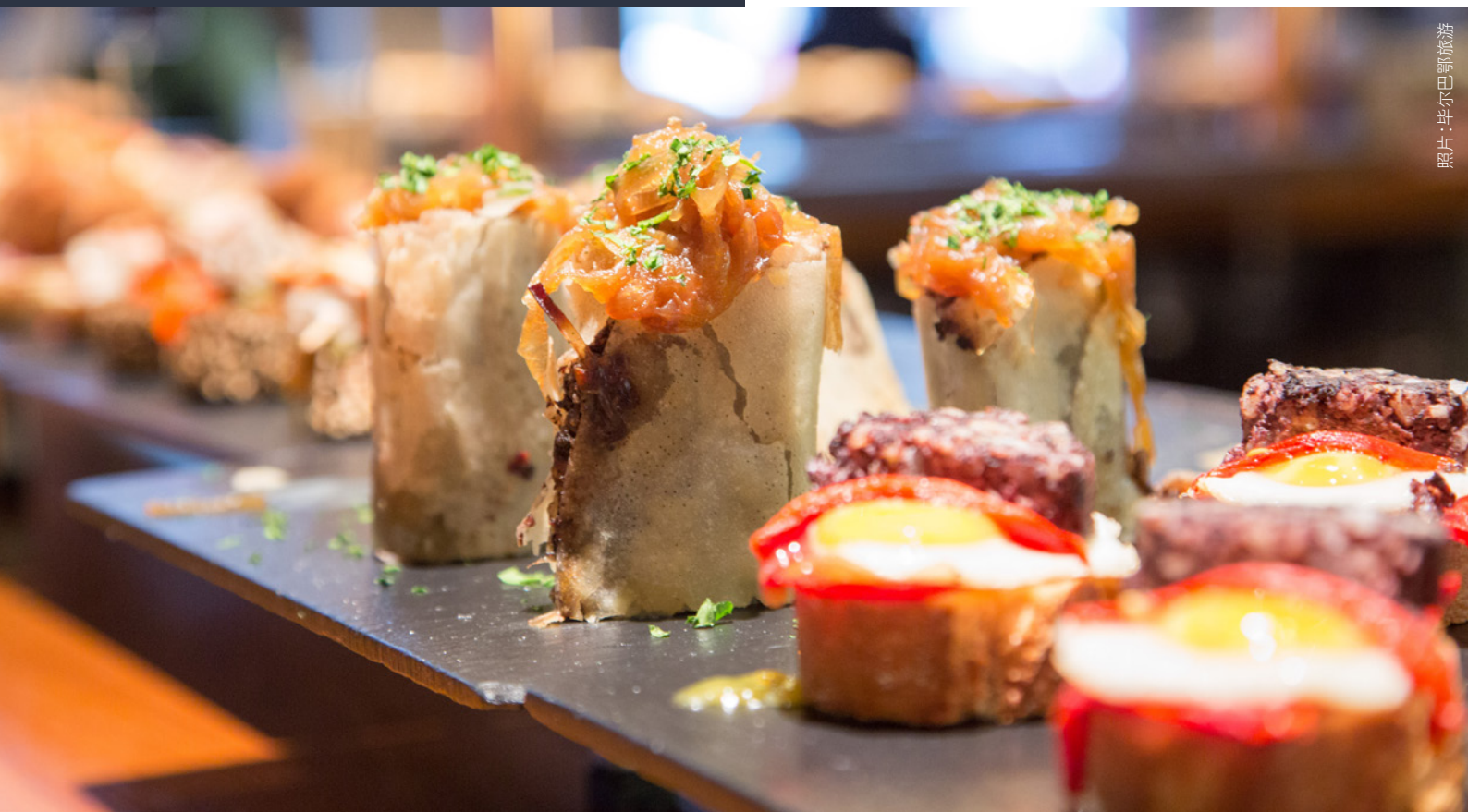
▲ 小吃 (PINTXO)