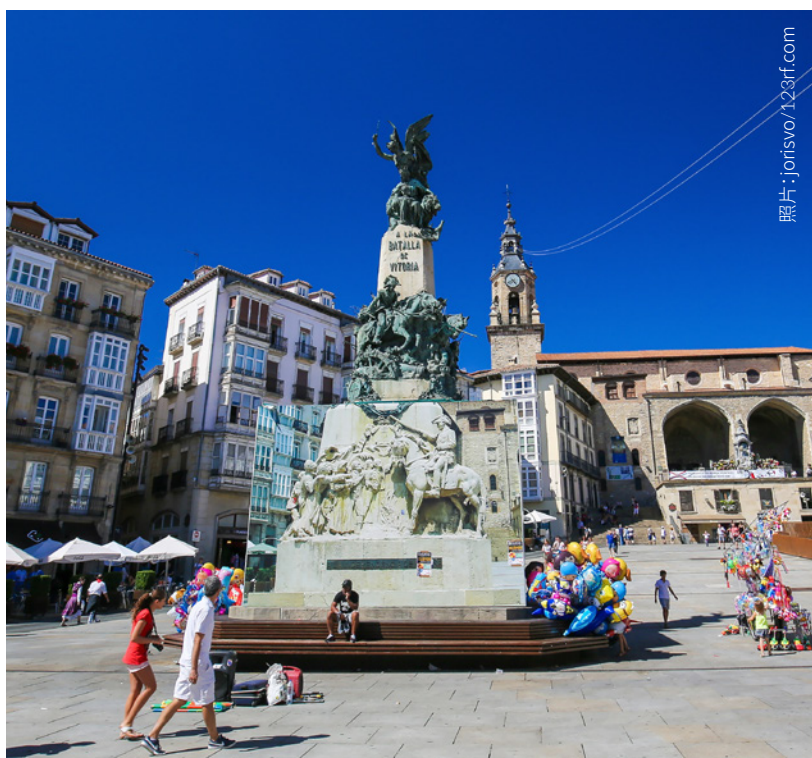
▼ 圣女布兰卡广场 维多利亚